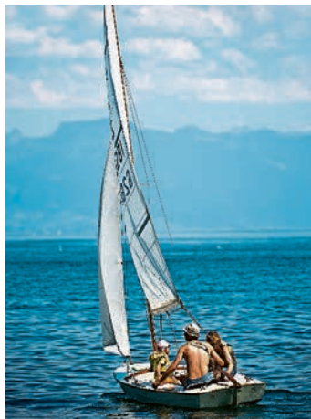
Segeln bleibt beliebt: Familie auf Genfersee bei Morges.

Vor allem die Breite der Plätze an den Stegen wird zunehmend zum Problem: Wer sich heute noch ein eigenes Schiff leistet, der will oft etwas Luxuriöses: «Es ist ein Trend zu grösseren Booten festzustellen», sagt Kiser. Liegeplätze von 2,2 Metern und kleiner seien eher wenig gefragt. «Entsprechend wird das Angebot von kleineren Bootsliegeplätzen tendenziell abgebaut zugunsten von grösseren, was bei unveränderter